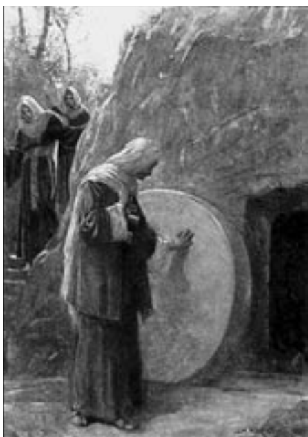
Mit kerestek a holtak között az élőt? Nincs itt, hanem feltámadt. (Lk 24,6)