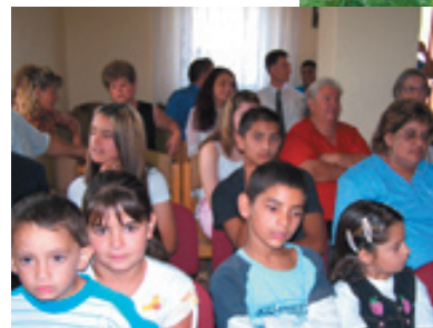
A gyülekezet az új imaházban

Munkatársunk látogatásakor a fényképek mellett hangfelvételt is készített az alkalomról a Cigányműsorhoz, amely kéthetente pénteken délelőtt hallható a rövidhullámon.