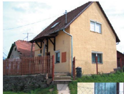
A képek a csobánkai cigány gyülekezet új imaházának ünnepélyes átadása előtti első istentiszteleten készültek.