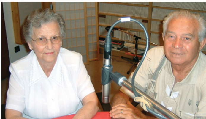
A felvétel a MERA stúdiójában készült a Mátrai házaspár legutóbbi látogatásakor